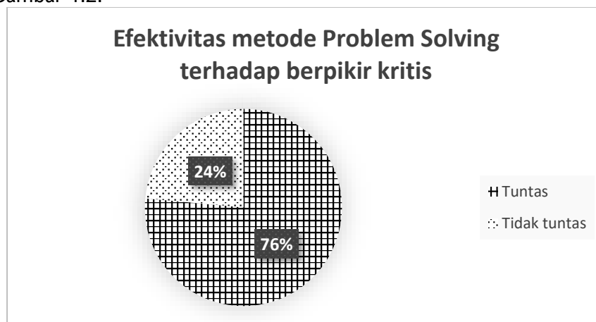
Gambar 1.2 Efektivitas metode Problem Solving terhadap nilai KKM

Penilaian efektivitas metode Problem Solving diperoleh dari persentase pencapaian dari siswa yang memenuhi atau lebih baik dari nilai 75 berdasarkan batas Kriteria Ketuntasan Minimum (KKM) yang telah ditentukan oleh sekolah. Adapun hasil penilaian efektivitas metode Problem Solving terhadap standar ketuntasan minimum yang dilihat dari nilai posttest ditunjukkan pada Gambar 1.2.